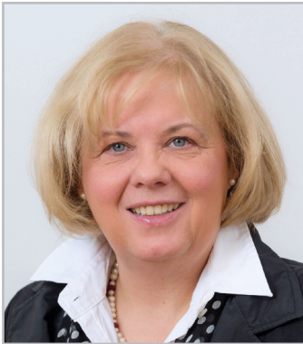
Annekathrin Preidel, Präsidentin der Landessynode der ELKB: