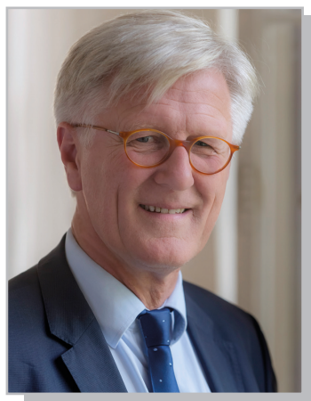
Heinrich Bedford-Strohm, Landesbischof:

Beim Klimaschutz fängt die ELKB nicht bei null an. Regionale Gebäudekonzeptionen, bisherige energetische Sanierungen, der Energiefonds und der Fonds „Räume für die Zukunft“ der Gemeindeabteilung, der Klimacheck Sparflamme und mehr als 130 Kirchengemeinden und Einrichtungen mit dem „Grünen Gockel“, dem kirchlichen Umweltmanagement, sind im integrierten Klimaschutzkonzept aufgenommen, gebündelt und fortgeführt. Gemeinden mit dem „Grünen Gockel“ sparen heute schon 4.000 Euro im Schnitt jährlich ein, die für die Gemeindearbeit verwendet werden können. Eine Vielzahl von